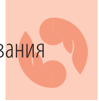
Таблица 2. Дизайн исследования